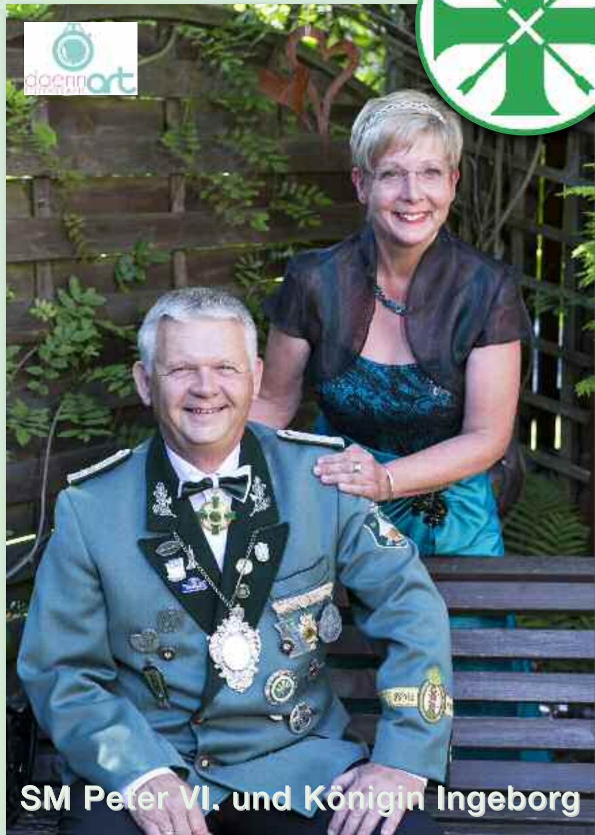
SM Peter VI. und Königin Ingeborg